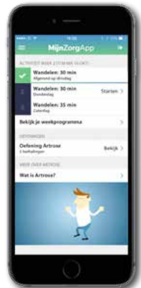
Voorbeeld van e-Exercise, geïntegreerd in MijnZorgApp

“Het gebruik van de AfsprakenApp scheelt bij ons per therapeut per week